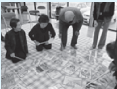
粟生のカルタ取りで、頭も足腰もきたえよう