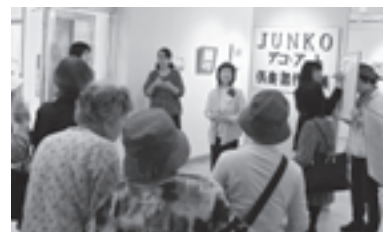
博物館へデコアート作品見学ツアー (平成24年4月25日)

サポートして下さるボランティアもいます。一日だけの見学でも構いません。興味のある方は、お気軽に参加して下さい！