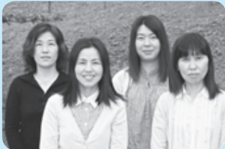
(新田・坂井・新川・谷)

能美ケアプランセンターたつのくちは、4人のケアマネジャーが常駐し、介護認定を受けられた皆様が、住み慣れた地域で『より安心で快適な毎日』を送れるようお手伝いしております。