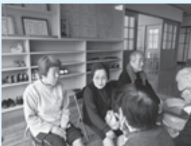
足湯でリラックスしている様子