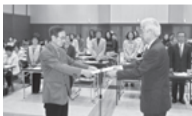
地域の見守り、支えあいの活動をよくお願ひします