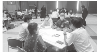
グループワークでそれぞれの取り組みを共有