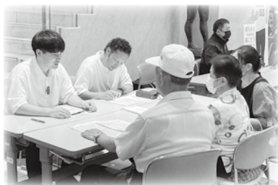
県の職員による相談会の様子

根上総合文化会館にて開催された「能登の復旧・復興を祈念するイルミネーション完成セレモニー(根上七夕まつり実行委員会企画)」に併せ、「じんのび☆のみのとカフェ」を開催しました。参加された方は交流を楽しまれていました。