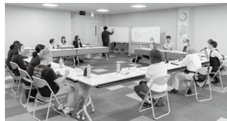
能美市成年後見地域連絡協議会の様子

くらしサポートセンターのみでは、成年後見制度の様々な疑問について、出前講座を行っています。ぜひお気軽にご相談ください。