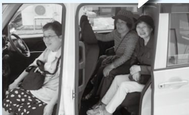
皆さんの笑顔が見れて、スタッフ一同嬉しかったです!