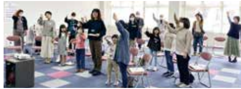
令和5年度 第1回のジュニボラ