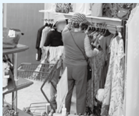
試着される姿も見られ、楽しそうな様子が見られました。

生活支援について、また貸出車輛「つなぐ号」のご相談は、社会福祉協議会までお問い合わせください。