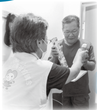
支援物資を手渡す生活支援相談員

能美市社会福祉協議会では、石川県から委託を受け、能美市内のみなし仮設住宅や公営住宅に入居されている方を訪問し、孤立防止のための見守り活動を行っています。