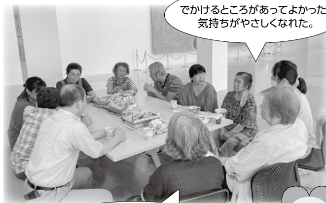
辰口福祉会館でのカフェの様子

8月21日(水)からカフェ会場はふれあいプラザとなりました。毎月第1・第3水曜日午後1時30分から3時までオープンしています。お気軽にお越しください。