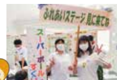
第16回ボラフェスの学生ボランティアさん