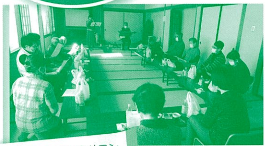
寺井横町いきいきサロン