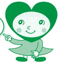
地域福祉推進のマスコットのみんなちゃん

賛助会員は、社協が行っている地域福祉活動に賛同される方なら、どなたでもなってもらえます。