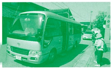
寺井中町おでかけサロン