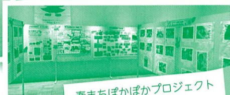
春まちぼかぼかプロジェクト パネル展示の様子