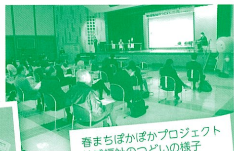
春まちぼかぼかプロジェクト 地域福祉のつどいの様子