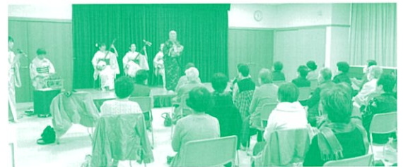
大成町いきいきサロン

いずれの活動も、助成をうけることで見守り・支え合いの活動の充実が図られています。