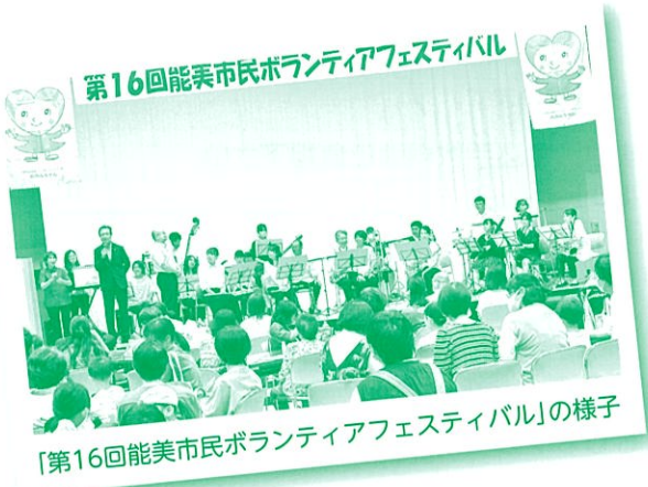
「第16回能美市民ボランティアフェスティバル」の様子

「春まち ぽかぽかプロジェクト」は、地域のいろいろな支え合い活動について話し合う機会として開催します。誰もが支え合いの地域づくりに関わる大切さを理解し、地域ぐるみの助け合いがすすむことを目指しています。